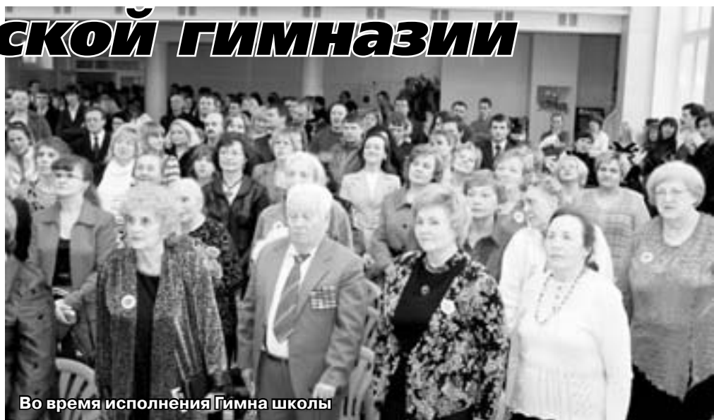
Во время исполнения Гимна школы

28 марта этого года Брюсовская гимназия отметила 40-летний юбилей. В следующем номере газеты мы подробно расскажем о прошедшем торжестве, представим слово ветеранам школы. А сейчас поздравляем педагогический коллектив и всех учеников с юбилеем Брюсовской гимназии. Желаем Вам успехов!